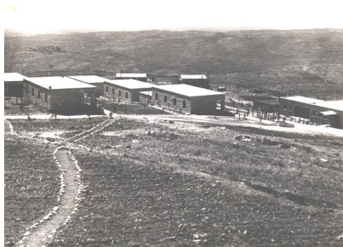
איור 3: מבט כללי על מבני הקיבוץ שהשתכנו בהם הנופשים בבית המרגוע במשוואות יצחק.

הכנת בית המרגוע על כל חלקיו והתאמתו למבוגרים הייתה מורכבת ולחוצה בזמן, כפי שמשתקף בדיון על מיקום השירותים והמקלחות במעורבותו של האדריכל בן אורי (בעולמנו 2, 14.2.1947, 10A תיק 3, עמ' 3, אכ"ע). הבנייה של המבנים הסינטיטיים וסככות