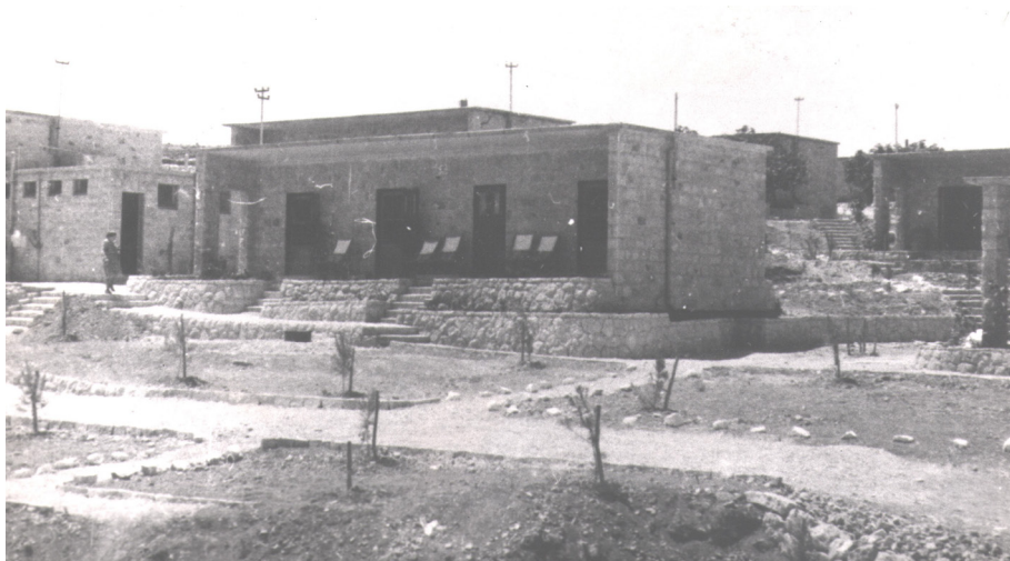
איור 8: מבני בית המרגוע והנוי סביבם, קיץ תש"ז.

הדים לוויכוחים אידיאולוגיים אלה לא נשמעו במשואות יצחק ובכפר עציון. הם לא ראו בעיה עקרונית במעמד של 'אדון ומשרת' שיוצרת עבודה מעין זו בחברה שוויונית. לא נותרו דיווחים מדויקים של כדאיות כלכלית, אך על פי המציאות בשטח, מסתבר שהייתה היתכנות כלכלית לבית מרגוע נוסף בהר מלבד זה של כפר עציון (לעיל).