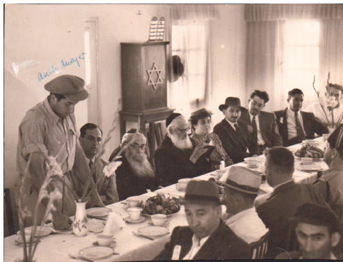
איור 6: חנוכת בית המרגוע במשואות יצחק, כ"ז בסיוון תש"ז.

כדאי לפתוח כה מוקדם (למשל כפר עציון פתחה את בית המרגוע בשנתו הראשונה רק באמצע חודש יוני). אך אפשר לומר בפה מלא שאין להתחרט על שפתחנו ב־23 במאי. היתרון בפתיחה מוקדמת הוא כפול: