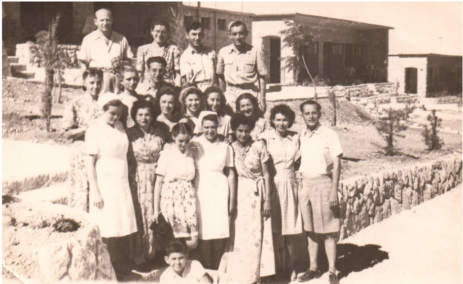
איור 4: קבוצת נופשים ואנשי צוות בבית המרגוע במשוואות יצחק, קיץ תש"ז.

שבוע ימים עברו מאז פתיחת בית המרגוע ובזה אנו מסכמים את חודש מאי. חששות מרובים היו בלבות החברים, האם בשנה הראשונה לקיום הענף הזה