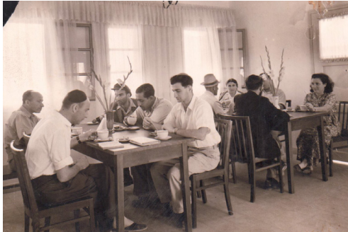
איור 7: נופשים בחדר האוכל בבית המרגוע, קיץ תש"ז.

למקום אחרי סיור באדמות הסביבה, קבוצה ראשונה של מבריאים ואורחים. תחילה סיירו במשק ובארבעת הבניינים של בית הבראה שבהם מקום ל-48 מיטות (שניים או שלושה בחדר), חדר אוכל מרווח וחדר קריאה נאה, שתי סככות הנשקפות על פני עמק נהדר ונוף הררי באויר רענן... (נחנך בית הבראה במשואות יצחק, הצופה, 16.6.1947, עמ' 1).